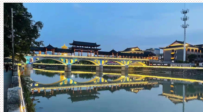
图为雁塔广场景观桥项目（市场发展部供图）